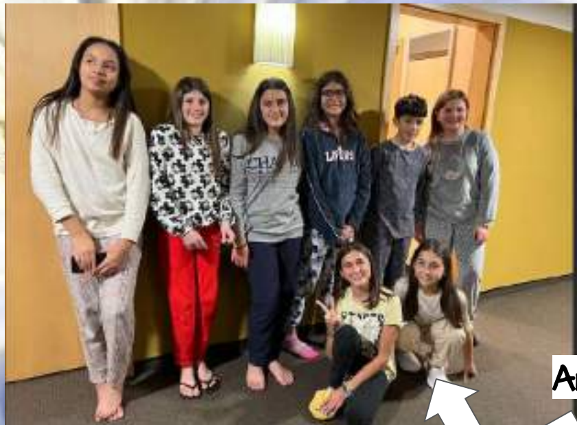
Amb les Italianes