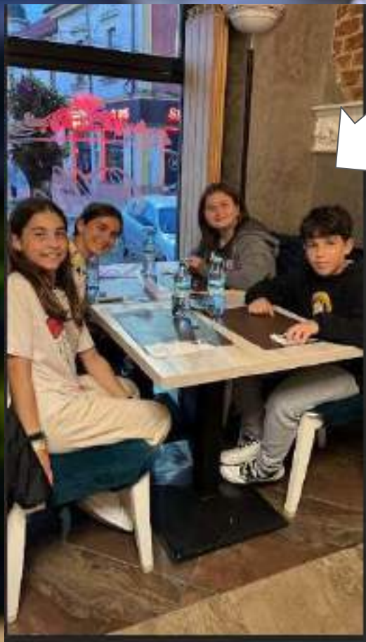
El primer sopar