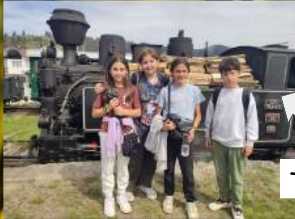
Tren de vapor